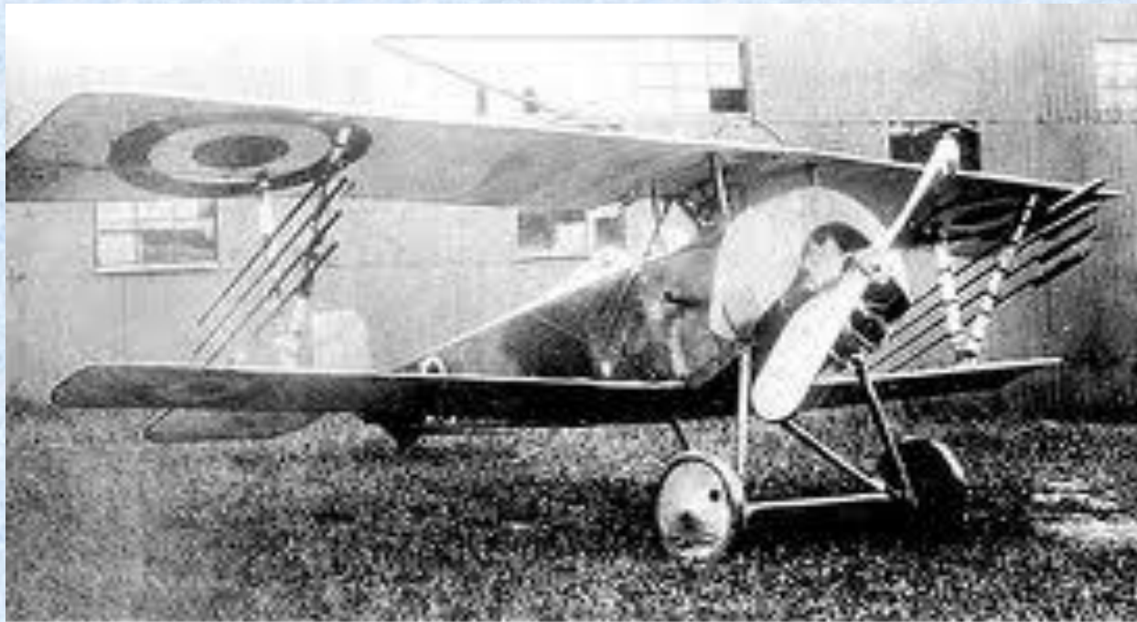
The rocket armed N959 in German hands. The ornate letter 'R' on the fuselage side of N959 was the insignia of the pilot flying it at the time of its capture, Adjutant Henri Ressayre. This machine was later test flown by a number of German pilots.